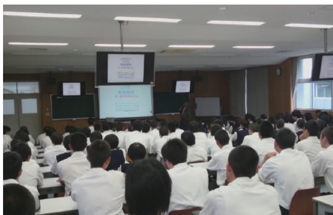
山口県立萩商工高等学校にて

また、対象年齢や希望内容に応じて、柔軟に対応もしておりますので、お気軽にご相談ください。