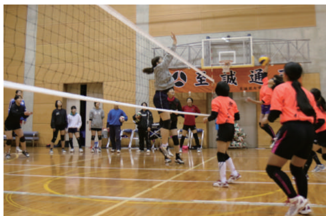
至誠館大学アリーナにて「バレーボール教室」